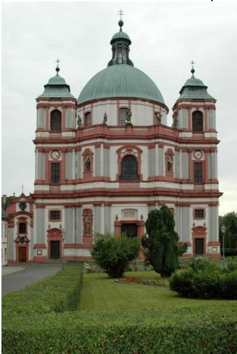
Bazilika svatého Vavřince a svaté Zdislavy